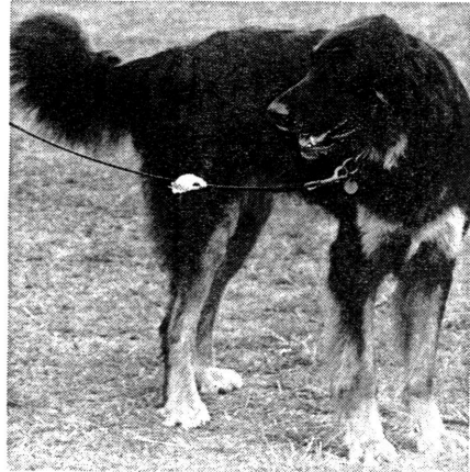
Hovawart-racen er ved at vinde indpas i Danmark, og er god som vagthund