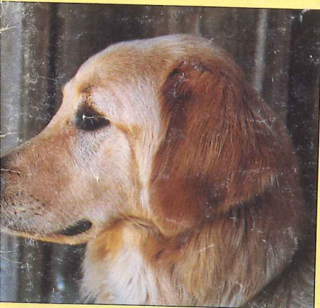
Hovawartens gode "næse" har skaffet racen mange jobs - bl.a. hos civilforsvaret.

Hunden har en meget smuk, underuldfattig langhårspels, med lange faner på benene og en flot busket hale, som i aktivitet bæres højt.