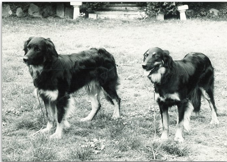
(ZB 5692/67; DKK 319523/67) Arras v. d. Scherenburg og (ZB 5675/67; DKK 319546/67) Halja v. d. Warthebrücke)