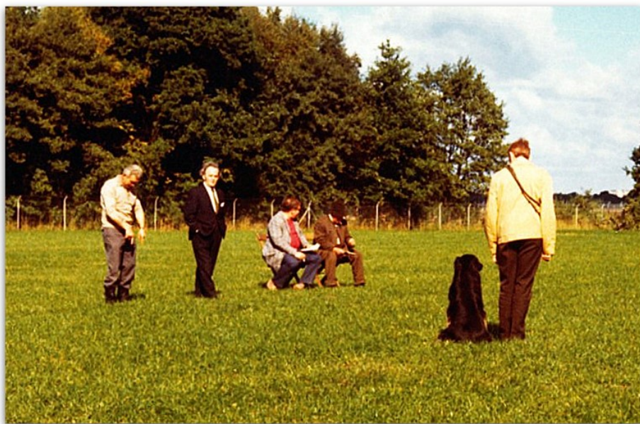
Tungehaves Arko til Kåring i Tyskland 1972

C: Var det altid i Tyskland man tog på udstilling?