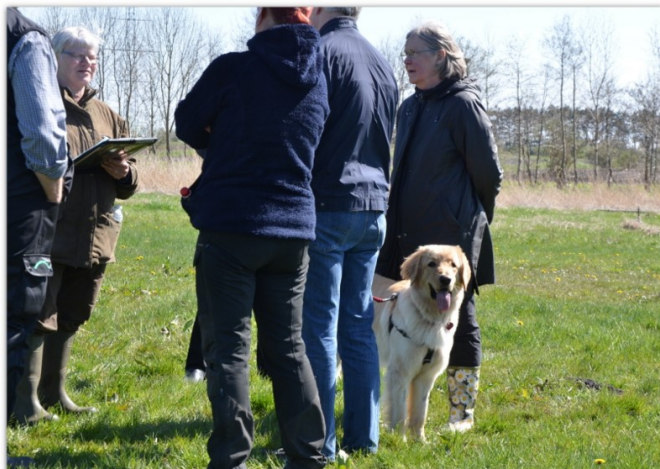
Cleohov's Baltra var også til beskrivelse

Når I læser dette indslag, vil DKK-mentalbeskrivelsen 5. juni i Slangerup også være gennemført med fuldt hold, desværre kun med 3 hovawarter, resten af anden race. Referat fra dagen vil komme i næste blad.